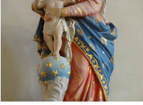
Étoiles parsemées dans les tissus, sculptures et fonds